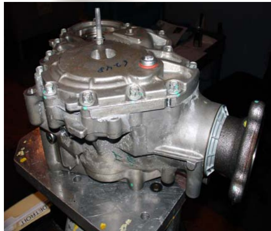
M8×1.25 TAPTITE 2000® 採用 (パワートランスファーユニット)