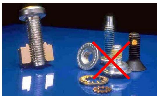
ゆるみ抵抗に優れているため、接着剤やワッシャーが不要です。

TAPTITE®, TAPTITE II®, TAPTITE 2000®は、CONTI Fasteners AGのライセンス品です。